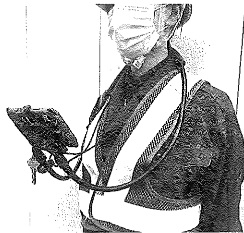
フレキシブルアームへのスマホ装着