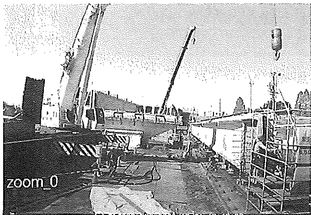
現場の画像