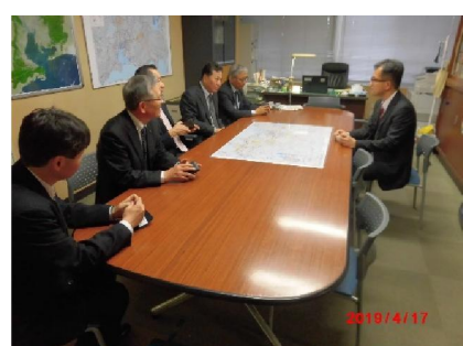
岩田中部地方整備局企画部長