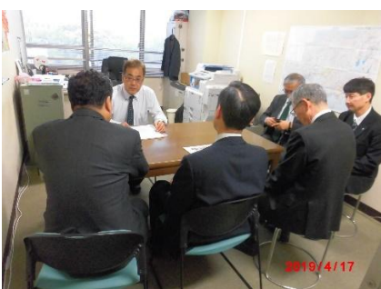
稲葉中部地方整備局技術調整管理官