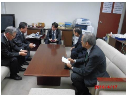
長谷川中部地方整備局副局長